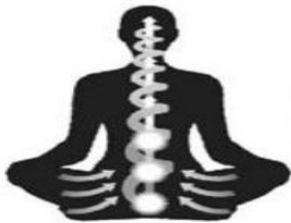
آزاد کردن انرژی از سه مرکز اول بدن به سمت مغز