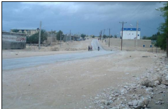
«نمایی از روستای خیر گو»

روستای خیر گو از بخش علامرودشت شهرستان لامرد از جنوبی ترین نقطه استان فارس، می باشد. این روستا در ۵۳۱۵ طول جغرافیایی و ۲۷۳۰ عرض جغرافیایی واقع است و در ۳۹۷ کیلومتری شیراز قرار دارد.